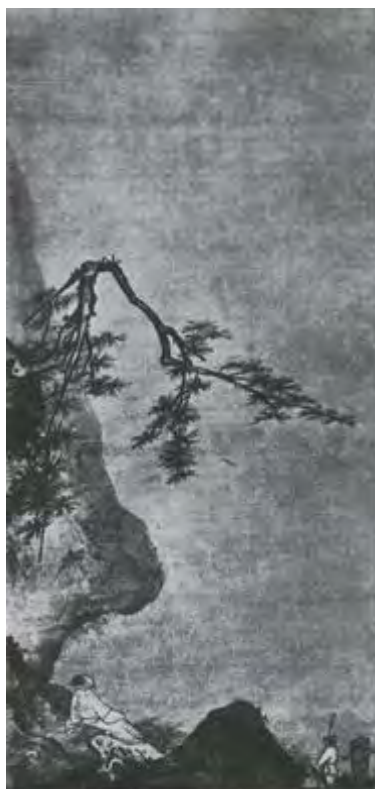
Ма Юань. Лунный свет. Живопись тушью на шелке. XII—XIII вв.