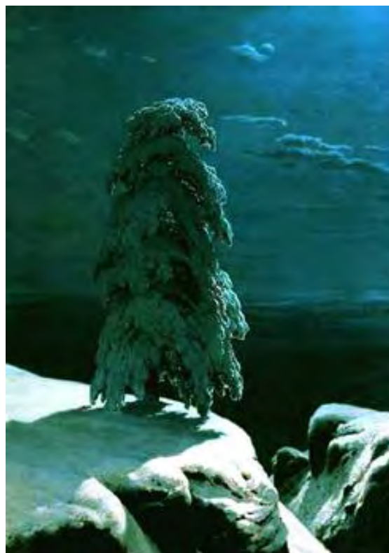
Иван Шишкин. На Севере диком... 1891

Такие задания направлены на выявление специальных предметных компетенций участников. В процессе выполнения задания необходимо провести анализ произведения, выявить его художественную идею, определить средства её реализации. В задании может быть предусмотрено проведение сравнительно-сопоставительного анализа разнородных (полярных) явлений художественной культуры. Участники олимпиады должны продемонстрировать понимание принадлежности произведения искусства той или иной национальной культуре, эпохе, художественной школе, стилю.